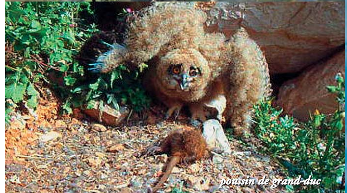
poussin de grand-duc

Si ce supplément vous a donné envie de mieux connaître les oiseaux,