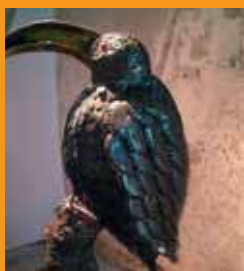
Charly Krüse, détournement d'objets